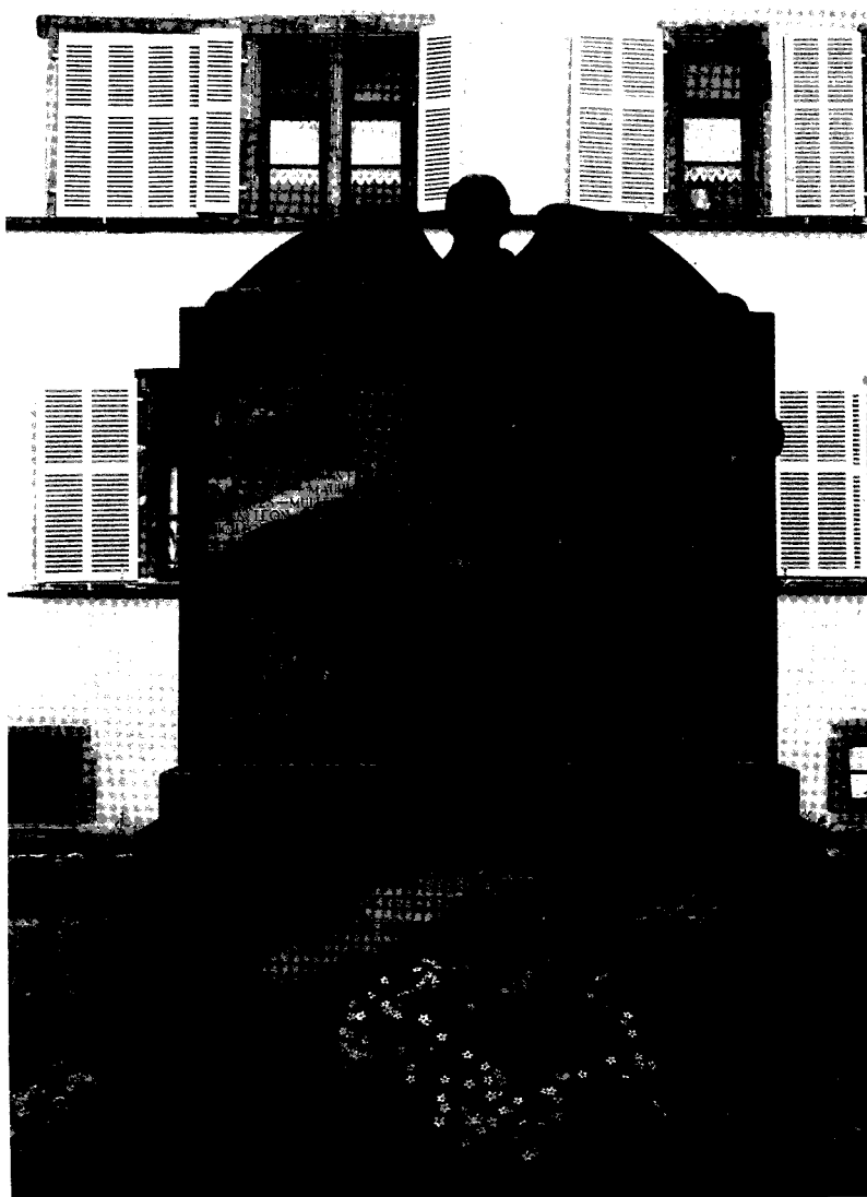
Monument als morts en les dues guerres mundials (1914-1918 i 1939-1945) a Riquewihr, Alsàcia.

Ian Kershaw pensa que el 1945 va ser un autèntic punt d'inflexió en la història europea del segle passat. Una llarga era de pau i prosperitat va succeir a la que pot anomenar-se la segona Guerra dels Trenta Anys europea, que va començar el 1914 i que va causar la mort i la destrucció sense precedents 9